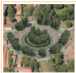
Piazzale Virgilio, Rondò dei Pini - Monza