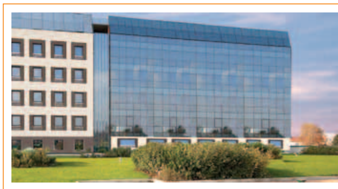
Vista dal Centro Commerciale

Uffici di pregio e rappresentanza, realizzati con grande attenzione al bilancio energetico. Varie metrature, ampia flessibilità e personalizzazione spazi.