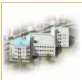
Uffici dell'Agenzia delle Entrate

Tutto ciò a dimostrazione di una efficace collaborazione tra pubblico e privato rivolta al servizio e al bene della collettività, nello spirito e missione aziendale della "civiltà del costruire."